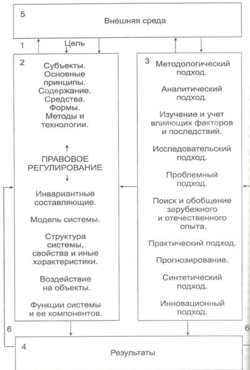
Рис. Общая схема системного структурирования и изучения информации о правовом регулировании государственного менеджмента

6. Обратная связь, служащая своевременному принятию решений по корректировке, совершенствованию и развитию компонентов правового регулирования, действий (деятельностей) по системному структурированию и изучению информации о правовом регулировании соответствующих общественных отношений, регулированию возникающих в процессе правового регулирования различных отклонений, включая конфликты и т.д. (рис., позиц. 6):