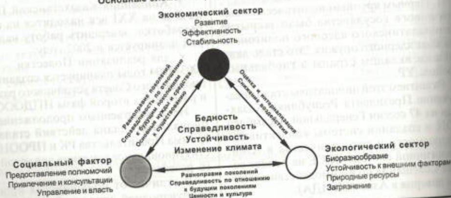
Основные элементы трехфакторной модели развития

Устойчивое развитие, к которому стремится общество, предполагает, что все эти сферы находятся в равновесии, гармонично взаимодействуют между собой и создают экономически и экологически благоприятную для человека среду обитания. Это направление работы приобретает стратегическое значение.