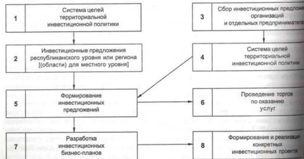
Схема этапов формирования и реализации инвестиционных проектов на региональном уровне управления

Организация и регулирование инвестиционной деятельности в отдельном регионе должны обеспечиваться органами территориального и отраслевого управления правительства (исполнительного органа), органами экспертизы и надзорными организациями. Цель такой работы – обеспечить комплексное развитие региона в соответствии с показателями градостроительной документации и с учетом проектной оценки социально-экономической и внешнеэкономической ситуаций в регионе на предстоящий период. К основным этапам организации и регулирования инвестиционно-строительной деятельности, формирования политики этой сферы в регионе следует отнести: